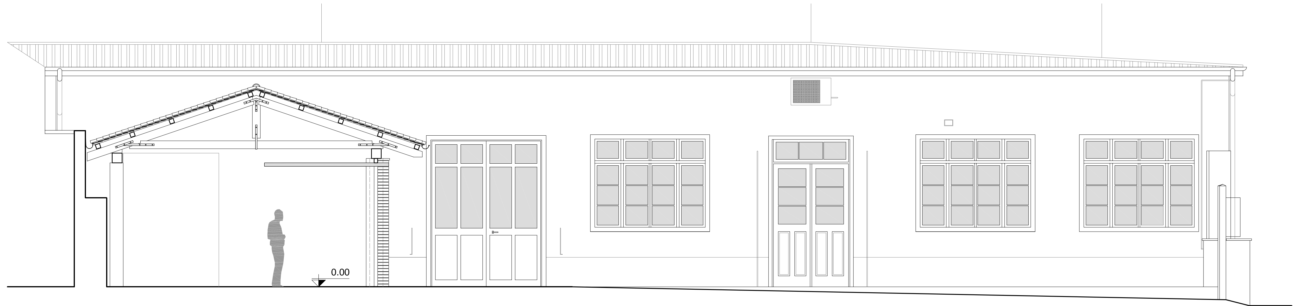
PROSPETTO NORD - SCALA 1:50